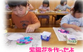
紫陽花を作ったよ