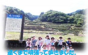
遠くまで頑張って歩きました。