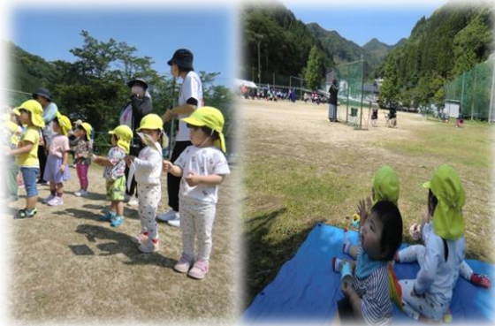
中学校の運動会を見に行きました

雨天で平日に延期になった中学校の運動会に行ってきました。いつも散歩で見なれた運動場にたくさんの人達がいる、いつもと違う雰囲気になった様子でしたが「あら、かわいいね」と地域の方々が声をかけて下さり「こんにちは」と手を振ってこたえていましたよ。シートを広げみんなで座って観戦しました。目の前を中学生のお兄さんお姉さん達が全速力で駆け抜けていく姿は迫力満点で、目を丸くして見とれていた子ども達。長時間になりましたが、途中水分補給もしながら楽しく観戦できました。以上児さんと合流してからは、旗を振り「頑張れ～」と大きな声を出して応援しました。